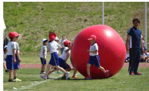
・2年団体 大玉ごときに負けられない！