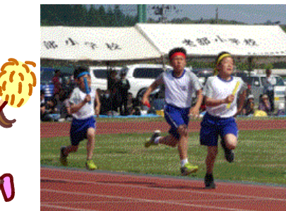
↑学級対抗リレー 激走！