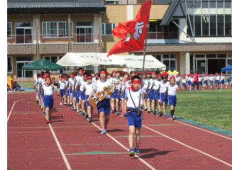
↑風にも負けず 意気揚々と入場行進！