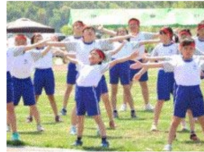
↑お見事 これぞラジオ体操！