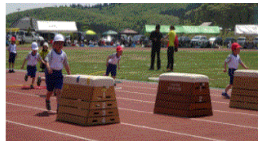
↑1・2年技能走は東通村の美味しいもの巡り！