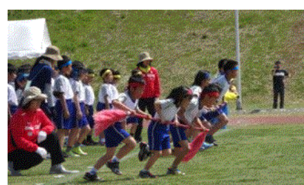
↑3年団体 渦潮様のお通りだ！