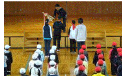
↑悪天候が続いたためほとんどの練習が体育館で行われました！

わずか2週間足らずの取り組みで、しかも、その間は悪天候続き……、グラウンドで全体練習ができたのは予行練習前日という状況でありながら、これだけ充実した運動会を行うことができたのは、教職員の緻密な計画と準備、そして、何よりも子どもたちの「やる気」を引き出す指導があったからこそだと思います。