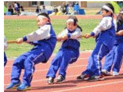
↑4年団体綱引きは 力と力のぶつかり合い！