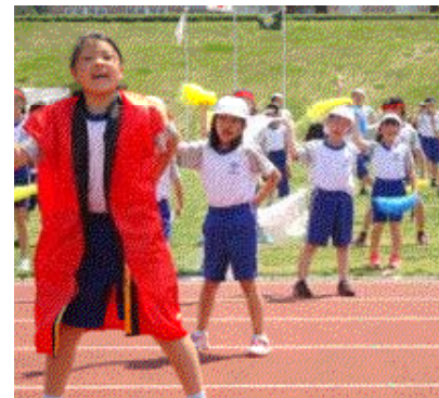
↑勇壮活発 よさこいソーラン