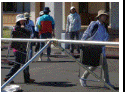
← 運動会前日の準備作業の様子 ↑