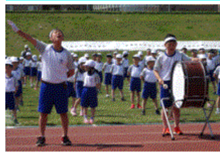
↑グラウンドに響き渡るエール交換！