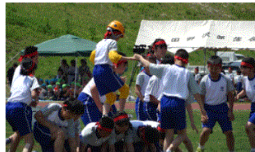
↑5年団体 友情の架け橋 ついに完成！